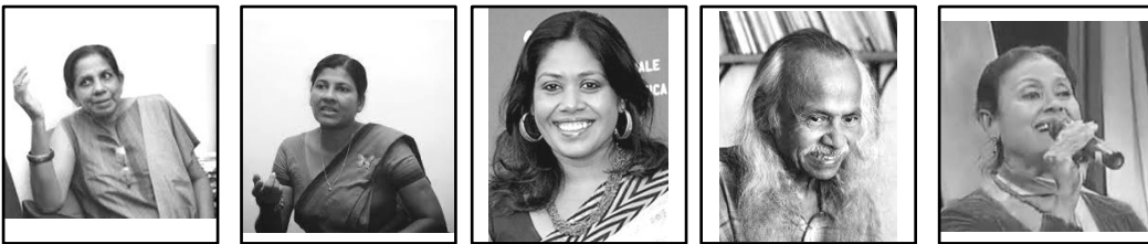
ක ග ජ ට ඩ