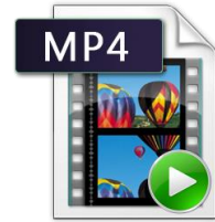
AKMKumara_VD _NelumdeniyaMV_G10 .mp4